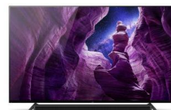
Pieds en position haute pour barre de son