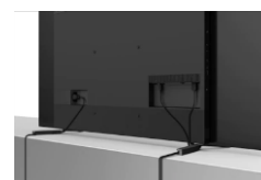
Passage de câbles intégré