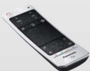
Télécommande tactile incluse