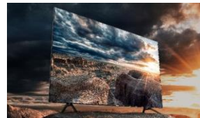
Quantum HDR 1500

Un rétroéclairage Direct LED associé à la technologie Local Dimming Silver qui permet un contraste plus profond et des détails plus précis.