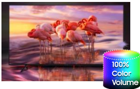
100 % du volume couleur

Grâce à la technologie Quantum Dots, votre TV capte la lumière et restitue une palette de couleurs d'un réalisme incomparable qui ne s'altèrent pas dans le temps.