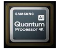
Quantum Processor 4K

Quelle que soit la lumière ambiante, profitez de tous les détails de l'image grâce à un contraste incomparable et un pic de luminosité jusqu'à 1500 nits.