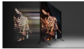
Full LED / Local Dimming Silver

Grâce à la technologie Quantum Dots, votre TV capte la lumière et restitue une palette de couleurs d'un réalisme incomparable qui ne s'altèrent pas dans le temps.